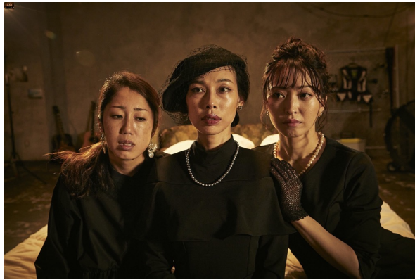
『truth～姦しき弔いの果て～』